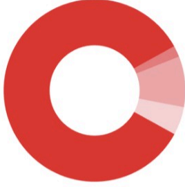
Güncel Fon Dağılım Oranı