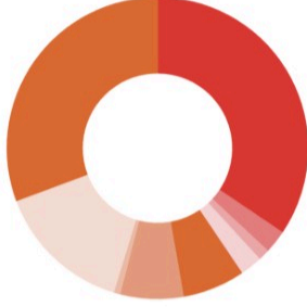
Güncel Fon Dağılım Oranı